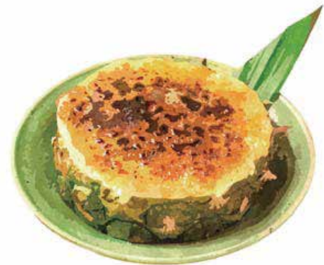
Pineapple Creme Brulee

〔おすすめトッピング:ココナッツアイス ¥150〕 〔Topping : Coconut Ice Cream〕