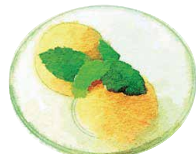
Ice Cream or Sherbet