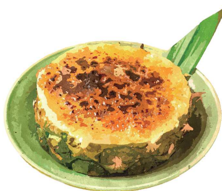
Pineapple Creme Brulee

[おすすりトッピング: ココナッツアイス ¥150] Topping : Coconut Ice Cream