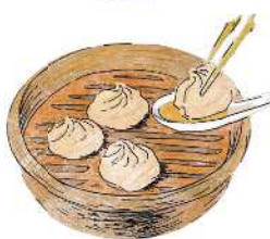
Tom Yum "Xiao Long Bao" Soup Dumplings (4 pieces) トムヤム小籠包 (4個) 680