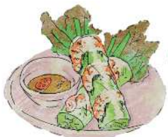
"Goi Cuon" Vietnamese Style Spring Roll (1 piece) ベトナム風生春巻き "ゴイクン" (1本) 380