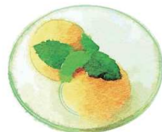
Ice Cream or Sherbet