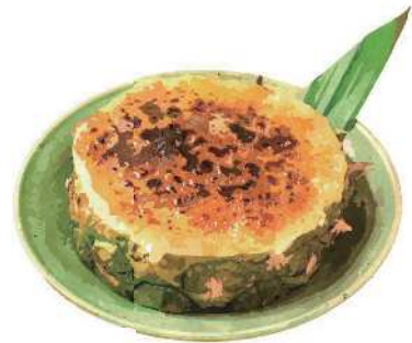
Pineapple Creme Brulee