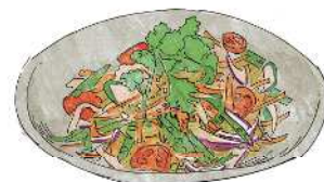
Roasted Pork Fillet & Green Papaya Salad 炙り叉焼と青パパイヤのサラダ 650