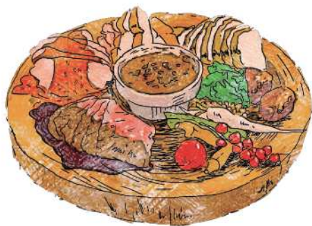
Monsoon "Butcher's Plate" Monsoon肉盛り 1,680