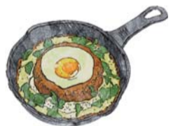
Mozzarella Keema Curry