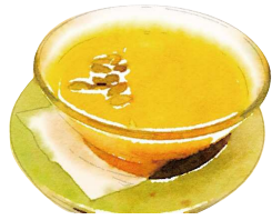
白玉かぼちゃぜんざい Pumpkin Zenzai