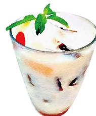
タピオカとコーヒーゼリーのチェー Tapioca and Coffee Jelly “Che”