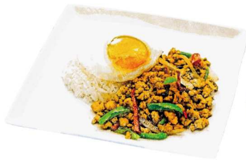
鶏肉のガパオライス Chicken "Gapao" Spicy Basil Rice (タイ米 or 酵素玄米) (Thai Rice or Enzyme Brown Rice)