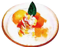
マンゴータンゴ Mango Tango