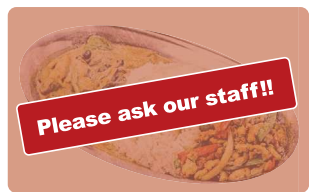
週替わりランチ Weekly Special ※内容はスタッフまでお尋ね下さい