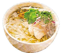
“鶏肉のフォー” “Pho” Soup Noodles with Chicken