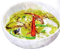
グリーンカレー Green Curry (タイ米 or 酵素玄米) (Thai Rice or Enzyme Brown Rice)