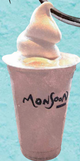
コーヒー フローズン Frozen Coffee & Ice Cream Float