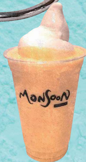
ソフトクリーム マンゴースムージー Mango Smoothie & Ice Cream Float