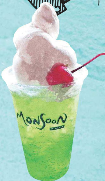
ココナッツ クリームソーダ Coconut Ice Cream Floats