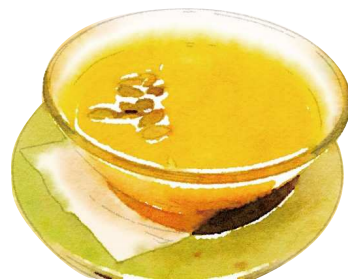
白玉かぼちゃぜんざい ¥550(税込605) Pumpkin Zenzai

[おすすめトッピング: ココナッツアイス ¥160(税込176) Topping: Coconut Ice Cream]