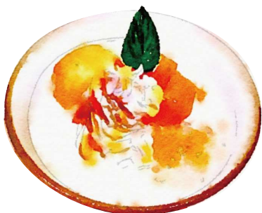
マンゴー タンゴ ¥680(税込748) ~マンゴーとタピオカのチェー~ Mango Tango

[おすすめトッピング: ココナッツアイス ¥160(税込176) Topping: Coconut Ice Cream]