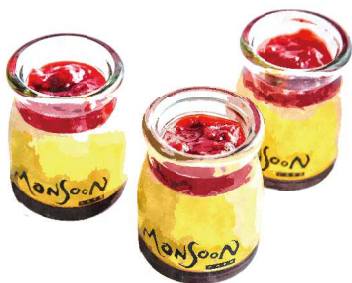
Monsoon プリン Monsoon Pudding