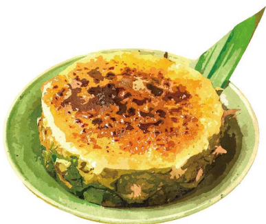
タイ屋台の パイナップルブリュレ ¥600(税込660) Thai Style Pineapple Creme Brulee

[おすすめトッピング: ココナッツアイス ¥160(税込176) Topping: Coconut Ice Cream]