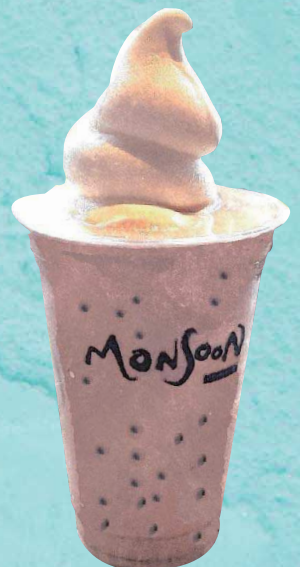
ソフトクリーム チャイ Chai Tea & Ice Cream Float