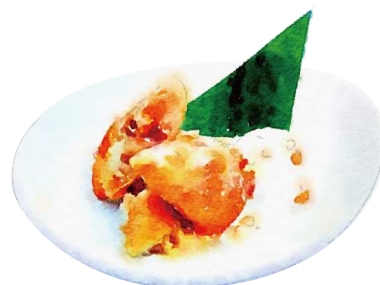
バナナロール ¥550(税込605) Fried Banana Roll

[おすすめトッピング: マンゴーシャーベット ¥160(税込176) Topping: Mango Sherbet]