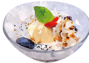
タピオカと コーヒーゼリーのチェー "Che" Tapioka & Coffe Jelly ¥680(税込748)