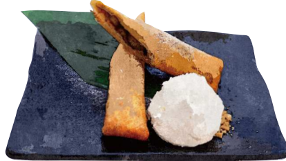
バナナロール Fried Banana Roll ¥580(税込638)