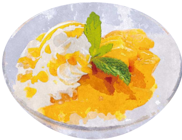
マンゴー タンゴ ~マンゴーとタピオカのチェー~ Mango Tango ¥680(税込748)