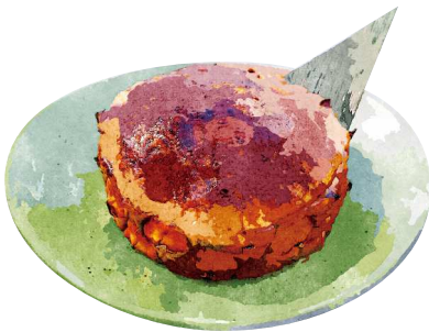
タイ屋台の パイナップルブリュレ Thai Style Pineapple Creme Brulee ¥680(税込748)

おすすめトッピング: ココナッツアイス Topping : Coconut Ice Cream ¥180(税込198)