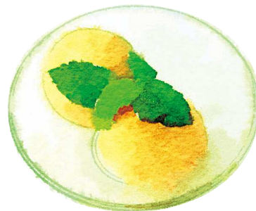
アイス・シャーベット Ice Cream or Sherbet ¥420(税込462)

おすすめトッピング: ココナッツアイス Topping : Coconut Ice Cream ¥180(税込198)