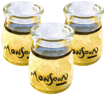
Monsoon プリン Monsoon Pudding ¥380(税込418)