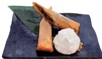
バナナロール Fried Banana Roll ¥580(税込638)