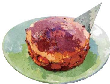
タイ屋台の パイナップルブリュレ Thai Style Pineapple Creme Brulee ¥680(税込748)

おすすめトッピング: ココナッツアイス Topping : Coconut Ice Cream ¥180(税込198)