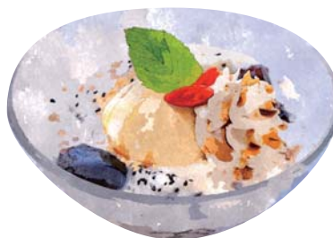
タピオカと コーヒーゼリーのチエー "Che" Tapioka & Coffe Jelly ¥680(税込748)

おすすめトッピング: ココナッツアイス Topping : Coconut Ice Cream ¥180(税込198)