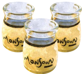
Monsoon プリン Monsoon Pudding ¥380(税込418)