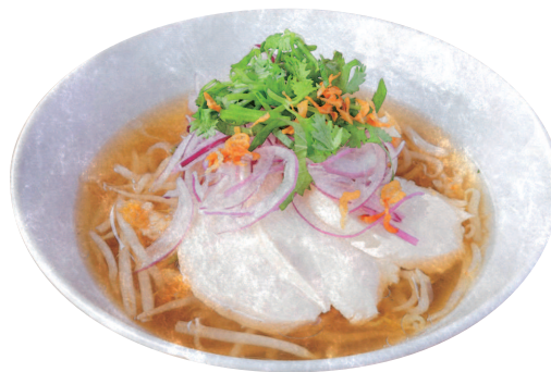
鶏肉と香味野菜のベトナムフォー "Pho" Soup Noodles with Chicken