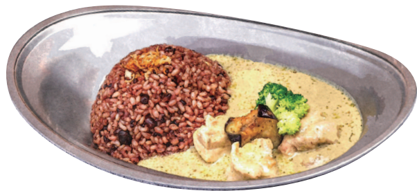
グリーンカレー Green Curry (タイ米 or 酵素玄米) (Thai Rice or Enzyme Brown Rice)