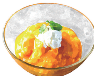
マンゴープリン Mango Pudding