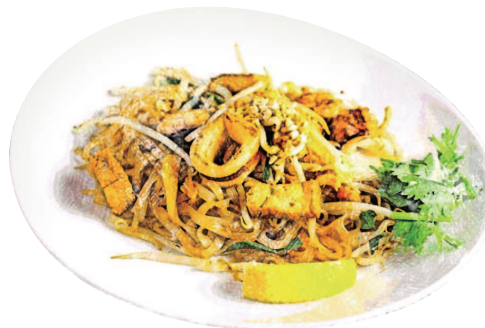
海鮮焼きビーフン“パッタイ” "Pad Thai" Thai Seafood Noodles

PORTION メイン料理大盛り ¥300 Extra Large Portion